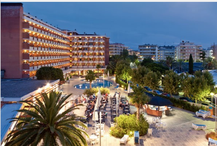
California Garden ***