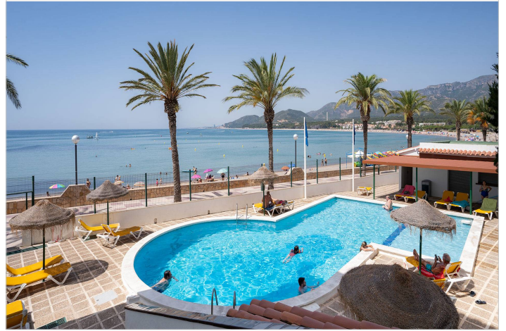
Medplaya Vistamar ***