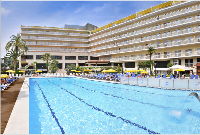
GHT Oasis Park ****